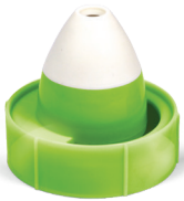
Adattatore nasale pediatrico (CHILD)