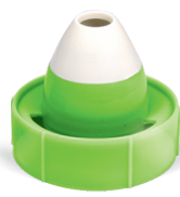
Adattatore nasale per adulti (ADULT)