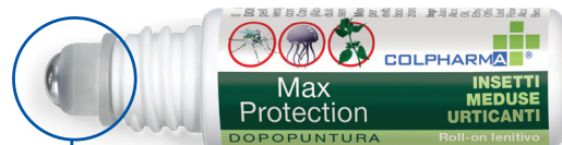
Con sfera in acciaio INOX

In display box da 12 pz. Cod. 12053 MAX PROTECTION DOPOPUNTURA