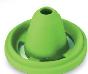
Adattatore nasale per adulti (ADULT)