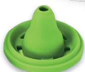
Adattatore nasale pediatrico (CHILD)

RACCOMANDATA per il trattamento di RINITI, RINOSINUSITI, ecc.