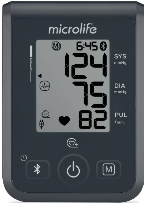
BP B1 BT